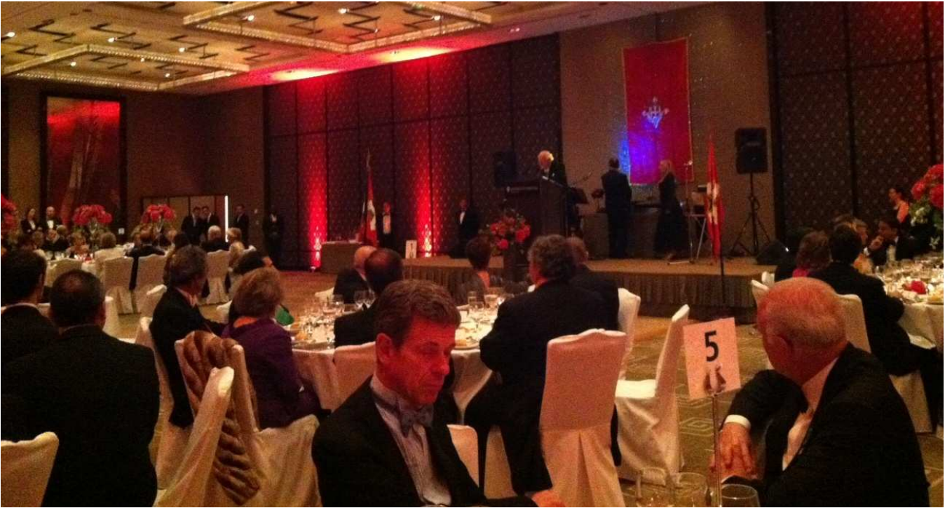
Cena di Gala all'Hotel Intercontinental. Saluto di S.A.R. il Generale Gran Maestro alle Dame ed ai Cavalieri intervenuti.