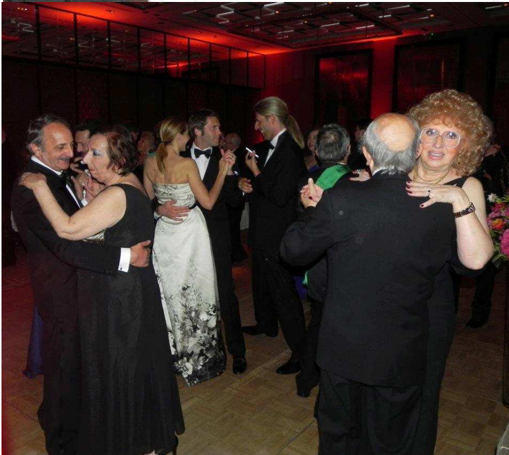
Momenti della cena di gala e del ballo all'Hotel Intercontinental